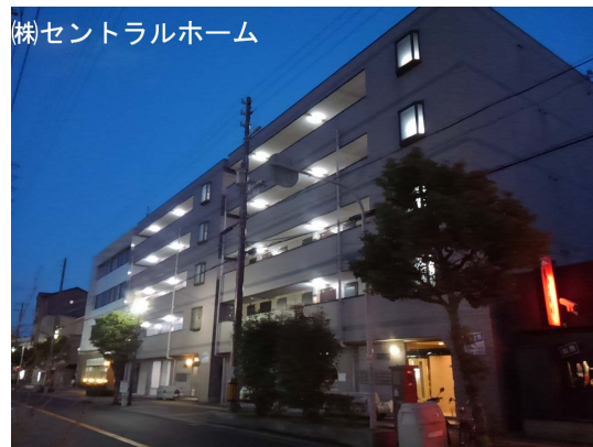
(株)セントラルホーム