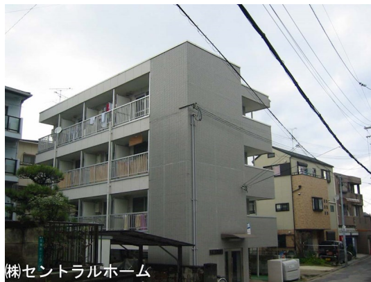
株セントラルホーム